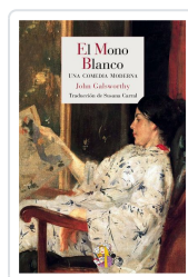
EL MONO BLANCO GALSWORTHY, JOHN