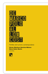
DE MARCO POLO AL LOW COST MARTÍNEZ SÁNCHEZ- MATEOS, HÉCTOR/RUBIO MARTÍN, MARÍA