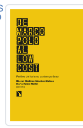
DE MARCO POLO AL LOW COST MARTÍNEZ SÁNCHEZ-MATEOS, HÉCTOR/RUBIO MARTÍN, MARÍA