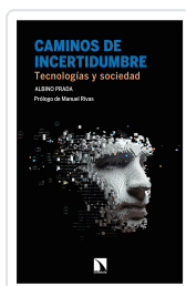
CAMINOS DE INCERTIDUMBRE PRADA, ALBINO