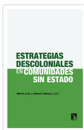
ESTRATEGIAS DESCOLONIALES EN COMUNIDADES SIN ESTADO LOIS, MARÍA / AKKAYA, AHMET