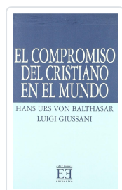
EL COMPROMISO DEL CRISTIANO EN EL MUNDO LUIGI GIUSSANI, HANS URS VON BALTHASAR