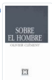
SOBRE EL HOMBRE OLIVIER CLÉMENT