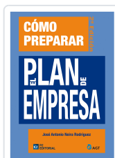
CÓMO PREPARAR EL PLAN DE EMPRESA 2ª ED JOSE ANTONIO NEIRA RODRIGUEZ