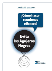
EVITA LOS AGUJEROS NEGROS ¡COMO HACER REUNIONES EFICACES! LOZANO PÉREZ, JOSÉ LUIS