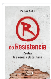
R DE RESISTENCIA CARLOS ASTIZ