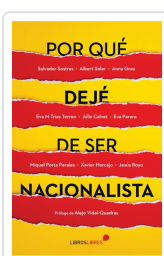
POR QUÉ DEJÉ DE SER NACIONALISTA AA.VV.