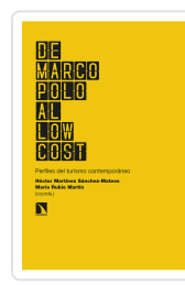
DE MARCO POLO AL LOW COST MARTÍNEZ SÁNCHEZ- MATEOS, HÉCTOR/RUBIO MARTÍN, MARÍA