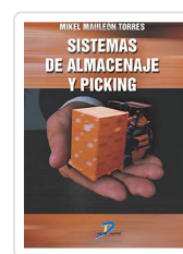
SISTEMAS DE ALMACENAJE Y PICKING MAULEON, M.