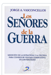
SEÑORES DE LA GUERRA, LOS VASCONCELLOS, J.A.