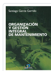
ORGANIZACIÓN Y GESTIÓN INTEGRAL DEL MANTENIMIENTO GARCÍA, S.