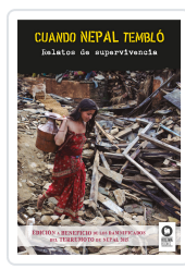
CUANDO NEPAL TEMBLÓ TEMBLÓ VARIOS AUTORES