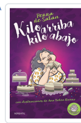
PERRA DE SATÁN, KILO ARRIBA, KILO ABAJO PERRADESATÁN