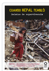
CUANDO NEPAL TEMBLÓ VARIOS AUTORES