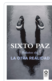
RELATOS DE LA OTRA REALIDAD PAZ WELLS, SIXTO