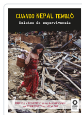
CUANDO NEPAL TEMBLÓ VARIOS AUTORES