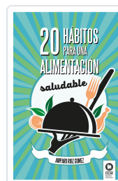
20 HÁBITOS PARA UNA ALIMENTACIÓN SALUDABLE RUIZ GÓMEZ, AMPARO