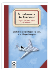
EL TESTAMENTO DE BEETHOVEN FERNÁNDEZ-RAÑADA DE LA GÁNDARA, MIGUEL