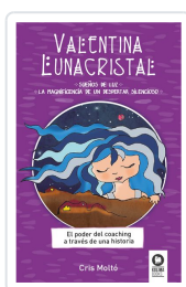
VALENTINA LUNACRISTAL MOLTÓ, CRIS