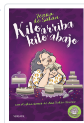
PERRA DE SATÁN, KILO ARRIBA, KILO ABAJO PERRADESATÁN