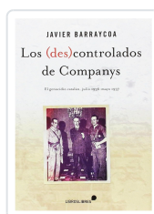
LOS (DES)CONTROLADOS DE COMPANYYS JAVIER BARRYCOA