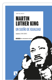
ANTOLOGÍA MARTIN LUTHER KING. UN SUEÑO DE IGUALDAD GOMIS, JOAN / DEL BUEY, RAMÓN