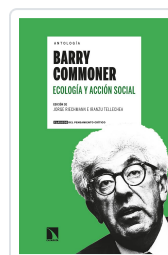
ANTOLOGÍA BARRY COMMONER. ECOLOGÍA Y ACCIÓN SOCIAL RIECHMANN, JORGE/TELLECHEA, IRANZU