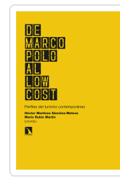
DE MARCO POLO AL LOW COST MARTÍNEZ SÁNCHEZ-MATEOS, HÉCTOR/RUBIO MARTÍN, MARÍA