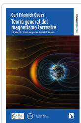
TEORÍA GENERAL DEL MAGNETISMO TERRESTRE FRIEDRICH GAUSS, CARL