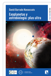
EXOPLANETAS Y ASTROBIOLOGÍA: PLUS ULTRA BARRADO NAVASCUÉS DAVID