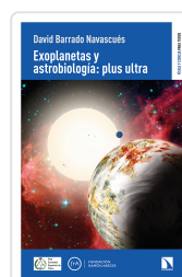
EXOPLANETAS Y ASTROBIOLOGÍA: PLUS ULTRA BARRADO NAVASCUÉS DAVID