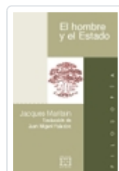
EL HOMBRE Y EL ESTADO JACQUES MARITAIN