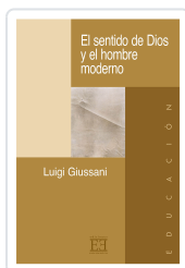
EL SENTIDO DE DIOS Y EL HOMBRE MODERNO GIUSSANI, LUIGI