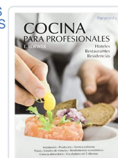
COCINA PROFESIONALES LOEWER, E.