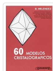
SESENTA MODELOS CRISTALOGRAFICOS MELENDEZ, B.