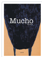
MUCHO RUIZ, SOL