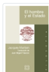
EL HOMBRE Y EL ESTADO JACQUES MARITAIN