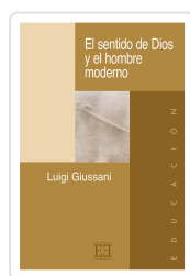
EL SENTIDO DE DIOS Y EL HOMBRE MODERNO GIUSSANI, LUIGI