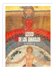
LÉXICO DE LOS SÍMBOLOS OLIVIER BEIGBEDER