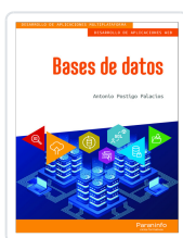
BASES DE DATOS POSTIGO PALACIOS, ANTONIO