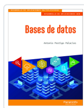
BASES DE DATOS POSTIGO PALACIOS, ANTONIO