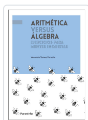
ARITMÉTICA VS. ÁLGEBRA TOMEÓ PERUCHA, VENANCIO