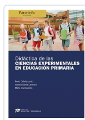
DIDÁCTICA DE LAS CIENCIAS EXPERIMENTALES EN EDUCACIÓN PRIMARIA // COLECCIÓN: DIDÁCTICA Y DESARROLLO CAÑAL DE LEÓN, PEDRO; GARCÍA CARMONA, ANTONIO; CRUZ-GUZMÁN ALCALÁ, MARTA