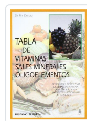
TABLA DE VITAMINAS, SALES MINERALES, OLIGOELEMENTOS DOROSZ, PH.