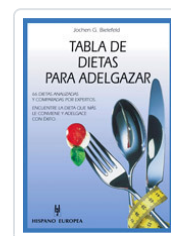
TABLA DE DIETAS PARA ADELGAZAR BIELEFELD, JOCHEN G.