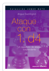
ATAQUE CON 1. D4 DUNNINGTON, ANGUS