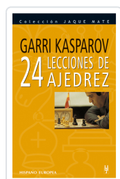
24 LECCIONES DE AJEDREZ KASPAROV, GARI