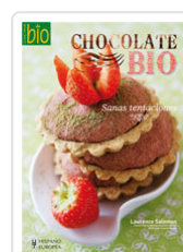
CHOCOLATE BIO SALOMON, LAURENCE