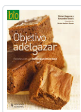
OBJETIVO ADELGAZAR DEGORCE, OLIVIER; GEERS, AMANDINE