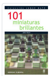
101 MINIATURAS BRILLANTES NUNN, JOHN