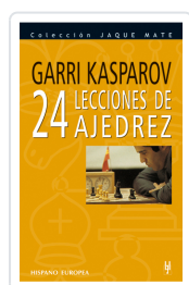
24 LECCIONES DE AJEDREZ KASPAROV, GARI