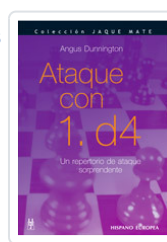
ATAQUE CON 1. D4 DUNNINGTON, ANGUS