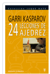
24 LECCIONES DE AJEDREZ KASPAROV, GARI