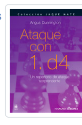
ATAQUE CON 1. D4 DUNNINGTON, ANGUS