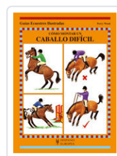
CÓMO MONTAR UN CABALLO DIFÍCIL WOOD, PERRY