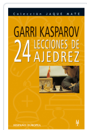
24 LECCIONES DE AJEDREZ KASPAROV, GARI