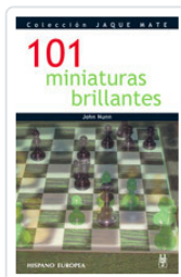
101 MINIATURAS BRILLANTES NUNN, JOHN