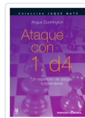
ATAQUE CON 1. D4 DUNNINGTON, ANGUS