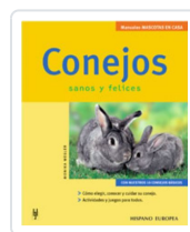
CONEJOS WEGLER, MONIKA