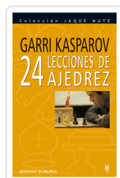
24 LECCIONES DE AJEDREZ KASPAROV, GARI