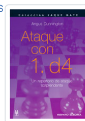
ATAQUE CON 1. D4 DUNNINGTON, ANGUS