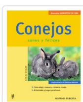
CONEJOS WEGLER, MONIKA