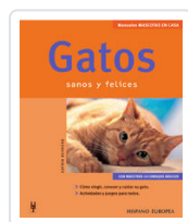
GATOS BEHREND, KATRIN