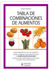
TABLA DE COMBINACIONES DE ALIMENTOS CARLSSON, SONJA