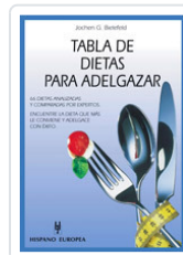
TABLA DE DIETAS PARA ADELGAZAR BIELEFELD, JOCHEN G.