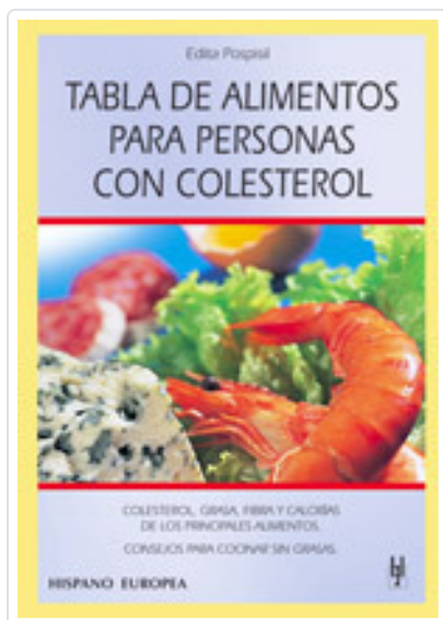
TABLA DE ALIMENTOS PARA PERSONAS CON COLESTEROL