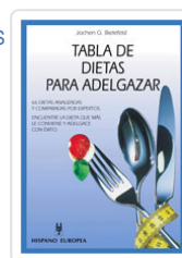
TABLA DE DIETAS PARA ADELGAZAR BIELEFELD, JOCHEN G.