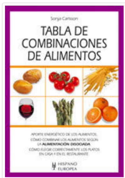
TABLA DE COMBINACIONES DE ALIMENTOS