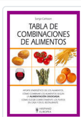
TABLA DE COMBINACIONES DE ALIMENTOS CARLSSON, SONJA