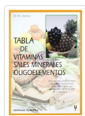
TABLA DE VITAMINAS, SALES MINERALES, OLIGOELEMENTOS DOROSZ, PH.