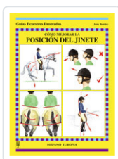
CÓMO MEJORAR LA POSICIÓN DEL JINETE BENTLEY, JONY