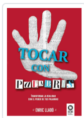
TOCAR CON PALABRAS LLADÓ MICHELÍ, ENRIC