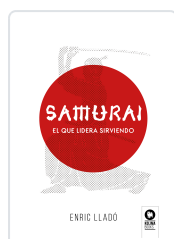
SAMURAI LLADO MICHELI, ENRIC