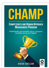
CHAMP CUÉLLAR, DIEGO