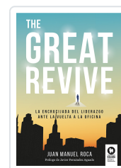
THE GREAT REVIVE ROCA, JUAN MANUEL