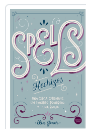
SPELLS (HECHIZOS) GINER, ELIA