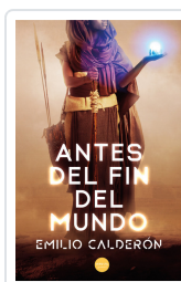
ANTES DEL FIN DEL MUNDO EMILIO CALDERÓN