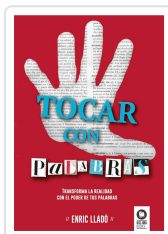
TOCAR CON PALABRAS LLADÓ MICHELÍ, ENRIC