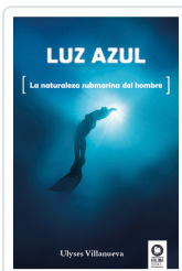
LUZ AZUL VILLANUEVA TOMAS, ULYSES