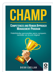
CHAMP CUÉLLAR, DIEGO